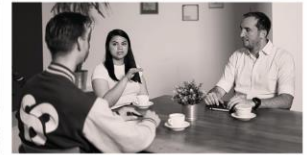
COACHING &amp; MENTORING