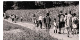
EVENTS UND PROJEKTE